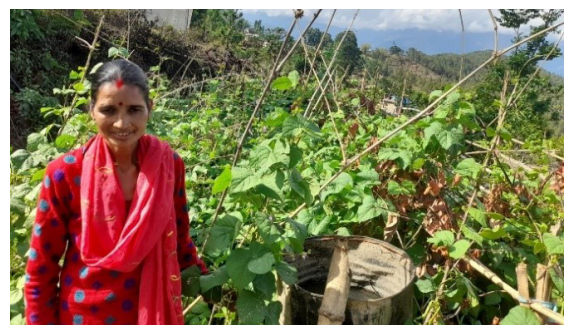
चित्र: दैलेखमा सिमीमा बिरुवा छेकवार प्रविधि अनुसन्धान पश्चात बिरुवामा उत्पादन राम्रो भएको

यो प्रविधि प्रयोग गर्न सजिलो र स्थानीय रूपमा बिना खर्च गर्न सकिने भएकाले किसानहरूले मन पराउन थालेका छन् । कर्णाली प्रदेशका जिल्लाहरू जस्तै: सुर्खेत, दैलेख लगायतका जिल्लाहरूमा यो प्रविधि किसानहरू माझ लोकप्रिय भएको छ । किसानहरूका अनुसार यो प्रविधि अपनाउनु भन्दा पहिला तरकारी वालीमा ७०-८०% सम्म क्षति हुने गरेकोमा यो प्रविधि अपनाए पश्चात ८०-९० % कलिला बेर्नालाई जोगाउन सफल भएको अनुभव बताउँछन् ।