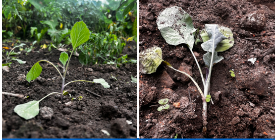
चित्र: फेद कटुवा किराको आक्रमण पूर्व (बाया) तथा आक्रमण पश्चात (दाया)