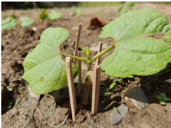
चित्र: बिरुवा छेकवार प्रविधि

फेद कटुवा कीराबाट किसानहरू सास्तीमा परेपछि, कृषि र वन विज्ञान विश्वविद्यालय, इसिमोड, सिप्रेड र ली-बर्डको साभेदारीमा स्थानीय प्रविधिबाट यसको समाधानको लागि कार्यमूलक अनुसन्धान गरिएको थियो । यस अनुसन्धानबाट "बिरुवा छेकवार प्रविधि" को सफल परीक्षण गरिएको छ । खर्च पनि धेरै नलाग्ने र सरल तरिका भएकाले किसानहरू यो प्रविधिलाई अपनाउदै आएका छन् ।